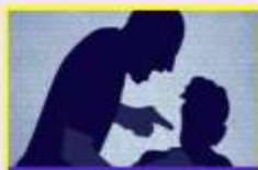
Abuzimi psikologjik dhe emocional