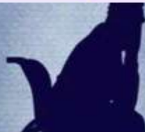
Neglizhimi ose braktisja